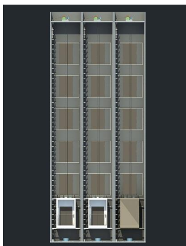
图 1：电梯模型外形示意图

电梯运动模型是以三维虚拟仿真的形式呈现，其主要包括：电梯整体（包括轿厢、电机、限位开关，等）、各个楼层按钮（上下行呼梯按钮及指示灯，等）、电梯内部设备（轿厢开关门按钮、轿厢选层按钮及指示灯，等），等等。电梯模型采用多部多层结构，其外形及样例示意图如下所示：